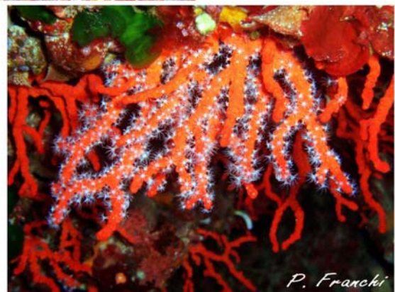
Encore un filet