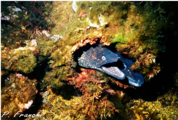
Murène et Congre